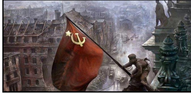
Ekim (Bolşevik) Devrimi'nden Bir Görüntü

13 Mart 1917 tarihinde Çarlık Rusyasının başkenti Petrograd'da [3 gerçekleşen ve Çarlık Monarşisinin yıkılmasıyla sonuçlanan Menşevik [4] Devrimi'nin ardından Rusya genel bir istikrarsızlık içine girmiş, yedi ay sonra o dönemde Rusya'da kullanılmakta olan Julyen Takvimine göre 25 Ekim 1917 (Gregoryen Takvimine göre de 7 Kasım 1917) tarihinde gerçekleşen Ekim Devrimi ile Bolşevikler Rusya'da merkezî iktidarı ele geçirmişlerdir.